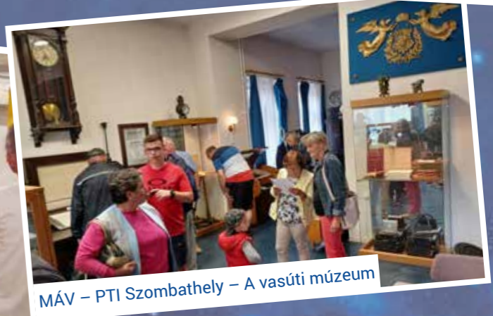
MÁV – PTI Szombathely – A vasúti múzeum