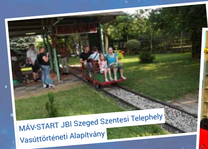
MÁV-START JBI Szeged Szentesi Telephely Vasúttörténeti Alapítvány