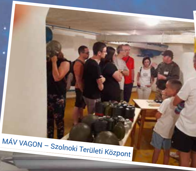
MÁV VAGON – Szolnoki Területi Központ