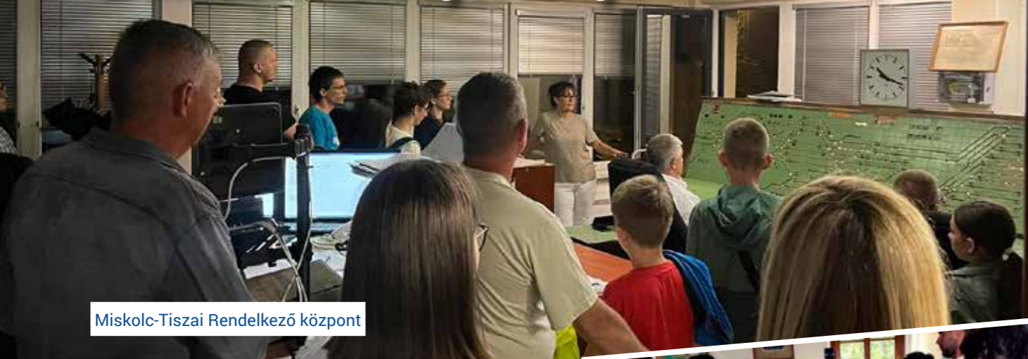
Miskolc-Tiszai Rendelkező központ

Varázslatos este, felejthetetlen élmények, tartalmas programok. Ilyen volt a 21. Múzeumok Éjszakája. Az abszolút trendfaktorba tartozó eseményhez természetesen a MÁV-VOLÁN-csoport is csatlakozott mint minden évben. Miről is szól a Múzeumok Éjszakája? Kaland, élmény és izgalom kicsiknek és nagyoknak egyaránt! Az a bizonyos éjszaka, amikor minden életre kel. Ahogy a korábbi években, úgy ebben az évben is munkatársaink tárlatvezetésekkel, interaktív eseményekkel, családi programokkal, valamint számos meglepetéssel készültek arra, hogy felejthetlenné tegyék ezt a varázslatos nyárestét.