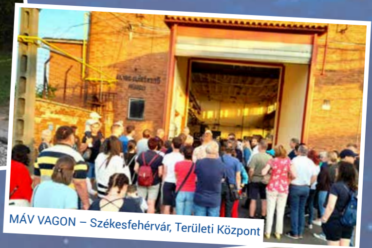
MÁV VAGON – Székesfehérvár, Területi Központ