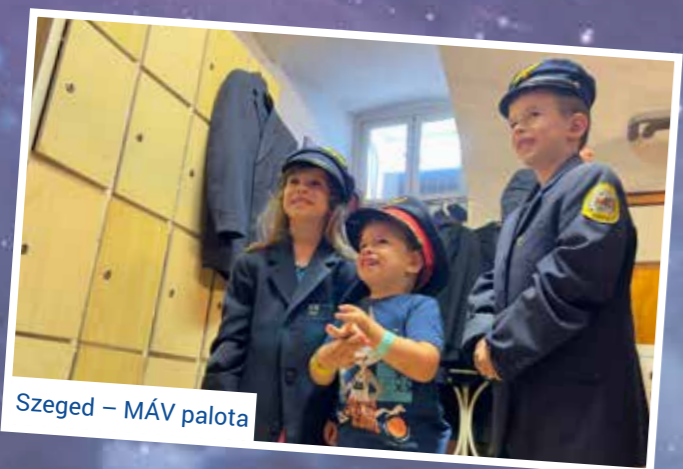
Szeged – MÁV palota