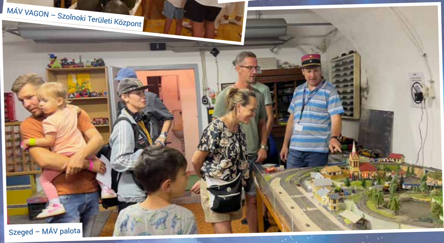
Szeged – MÁV palota