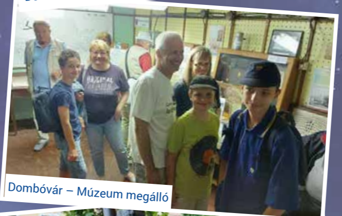
Dombóvár – Múzeum megálló