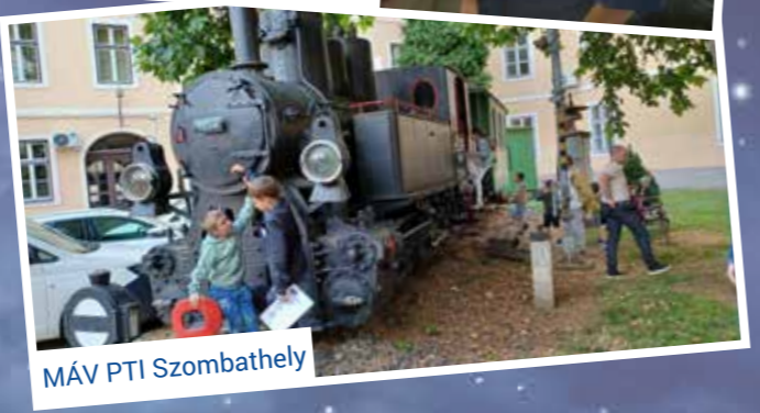
MÁV PTI Szombathely